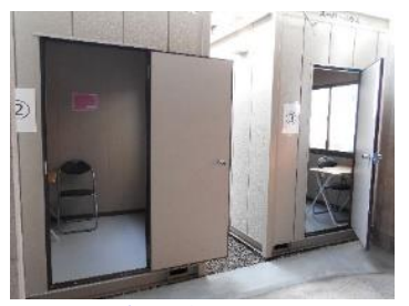
11月22日、当番医で発熱者対応の様子。