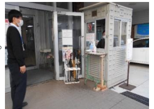
正面玄関でトリアージ

以上のようにハード面の整備がなされ、職員も患者様も安心して診療が出来るようになりました。職員の知恵、創意工夫で使いやすく改善されましたが、まだまだ進行中です。グレードアップに向けて、気づいたことやアイデアなどアドバイスをお願いします。職員への行動自粛のお願い・事前に移動届けによる報告・毎日の検温・体調が悪い場合は医師に相談してから仕事の加不を判断する、など実行されています。いかに感染予防の意識が高いかがわかります。医療従事者へのワクチン接種に向けた動きも始まりました。ワクチンの効果に期待を持っています。しかし、まだまだこの状況が続きます。自己の健康管理、行動自粛などストレスも多いですが、感染対策技術向上の期間と考え大きな山を乗り越えましょう。